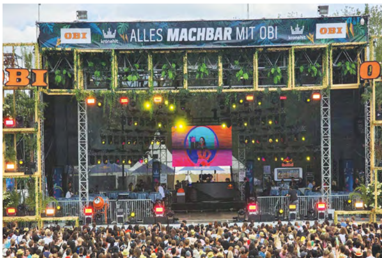
가, 가, 가 Donauinselfest K-POP Concert, Lightsum, 2022, Electronic Stage(1),(2)