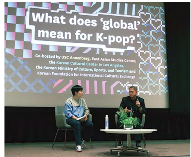
➤ K-POP FESTA, 김세정, 킹덤, 2022, USC McCarthy Quad (2) ➤ K-POP Forum, 2022, Wallis Annenberg Hall (1)