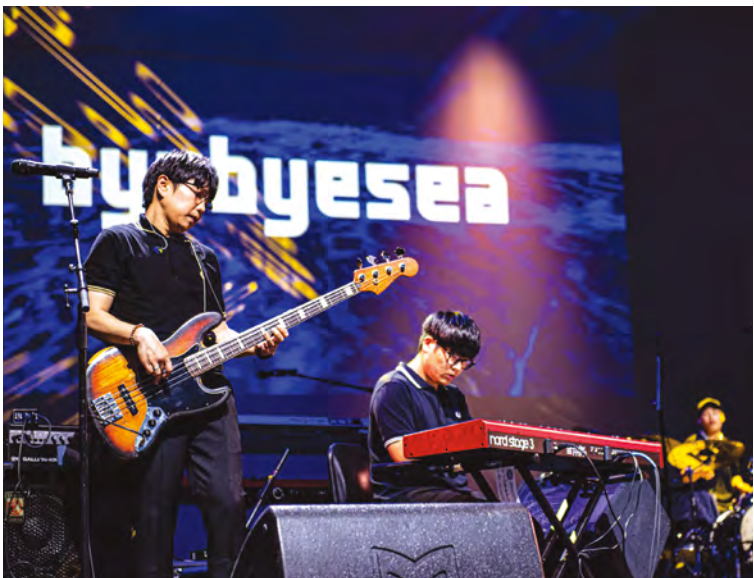
가 뉴욕 K-인디음악의 밤, 안녕바다, 2022, 링컨센터_2 가가 뉴욕 K-인디음악의 밤, 안녕바다, 2022, 링컨센터_3