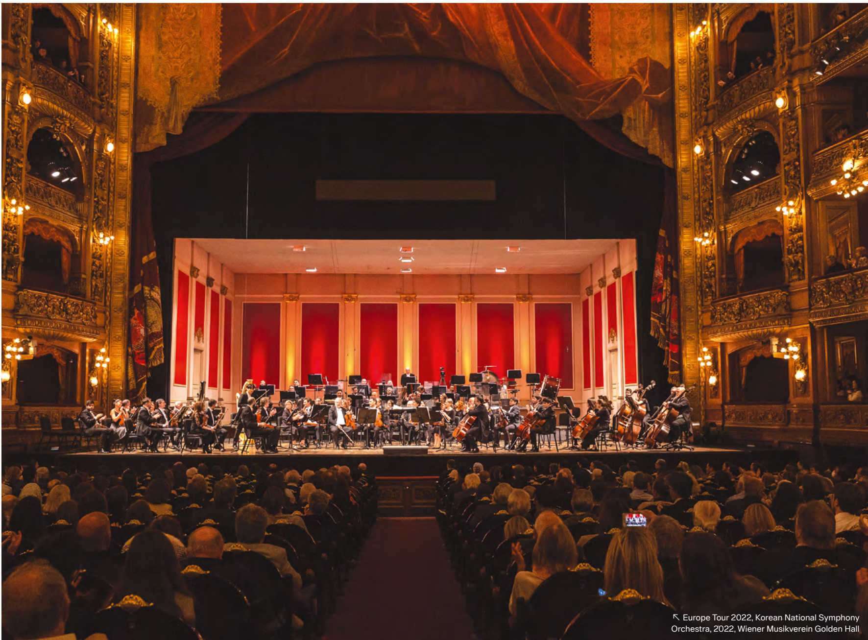
Europe Tour 2022, Korean National Symphony Orchestra, 2022, Wiener Musikverein Golden Hall