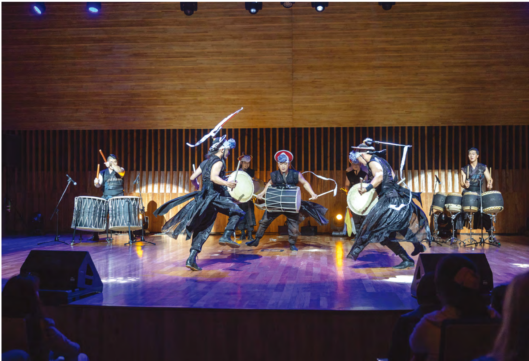
↗ Concert for the 60th anniversary of diplomatic relations between Korea and Argentina, TAGO, 2022, Centro Cultural Kirchner