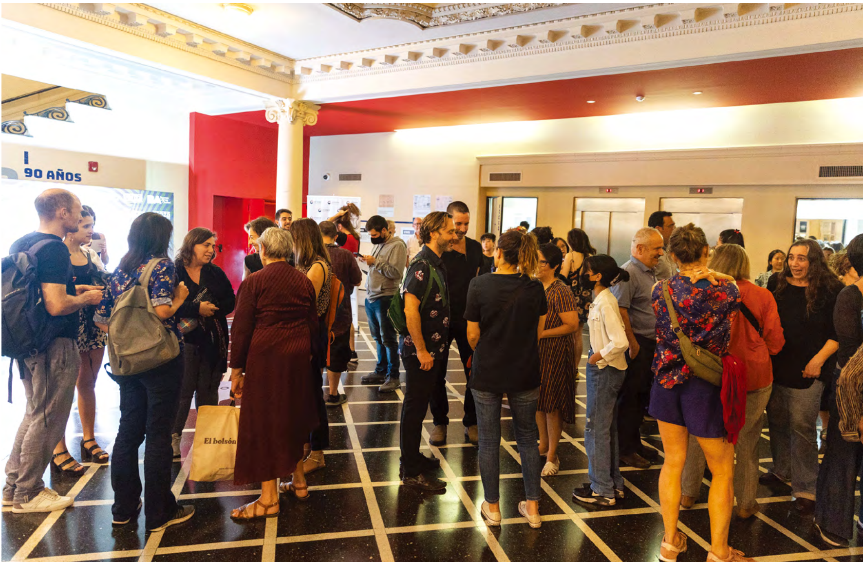
↗ Concert for the 60th anniversary of diplomatic relations between Korea and Argentina, Modern Table, 2022, Centro Cultural 25 de Mayo