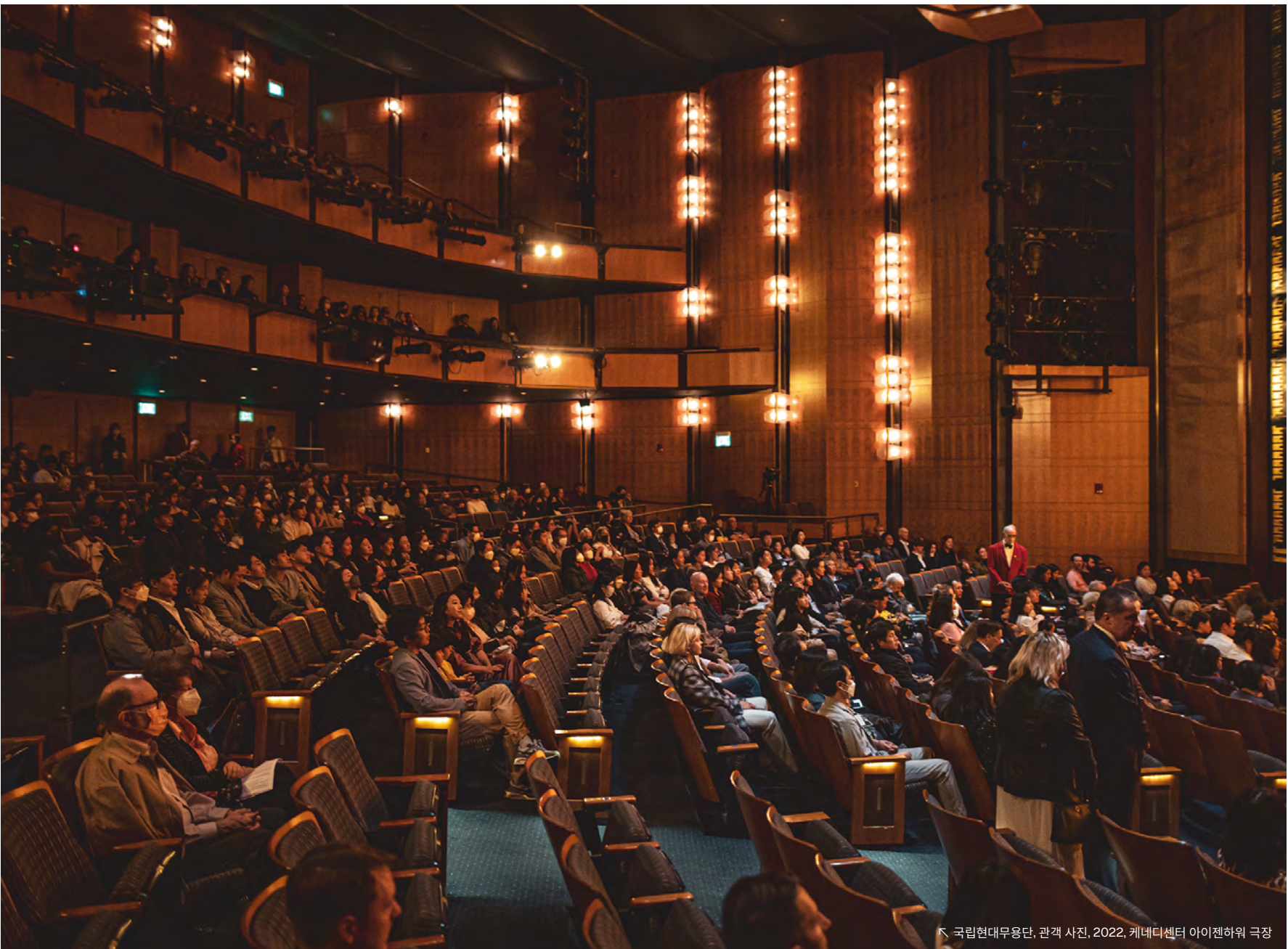
국립현대무용단, 관객 사진, 2022, 케네디센터 아이젠하워 극장