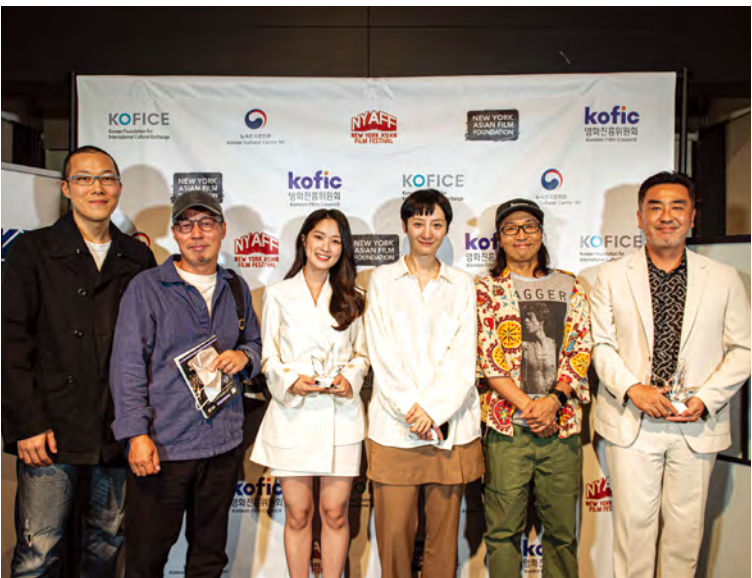
가, 가, 가 뉴욕아시아영화제 한국영화특별전 2022