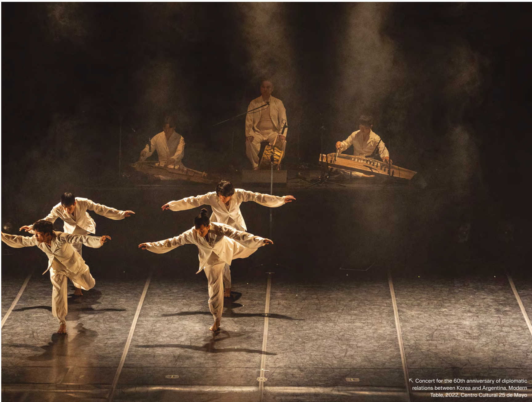
Concert for the 60th anniversary of diplomatic relations between Korea and Argentina, Modern Table, 2022, Centro Cultural 25 de Mayo