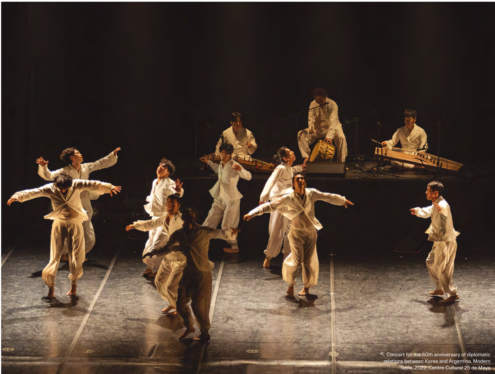
Concert for the 60th anniversary of diplomatic relations between Korea and Argentina, Modern Table, 2022, Centro Cultural 25 de Mayo