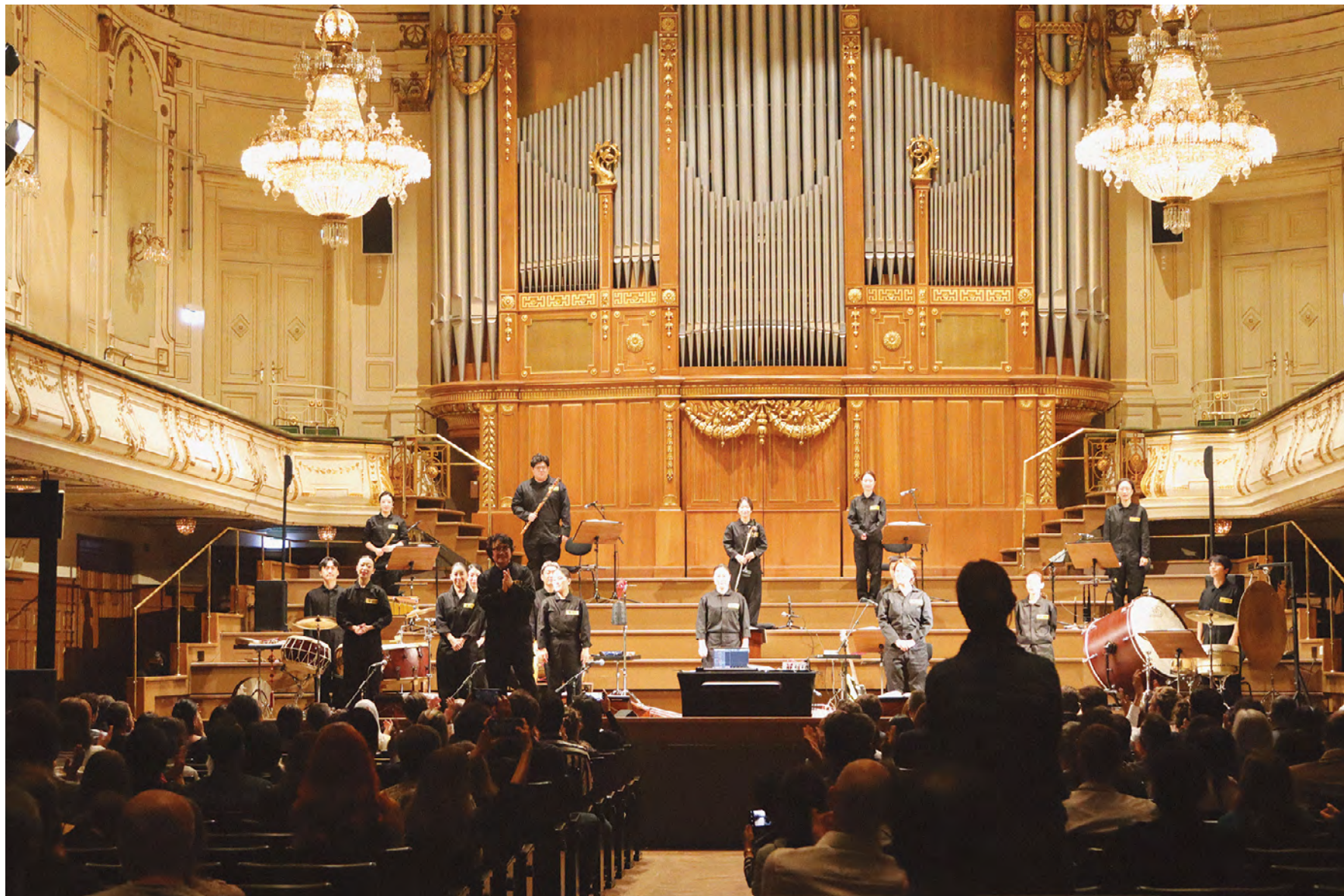
➤ Gyeonggi Sinawi Orchestra Europe Tour, Gyeonggi Sinawi Orchestra, 2022, Wiener Konzerthaus-Mozart Hall