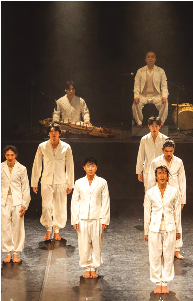
가, 나 Concert for the 60th anniversary of diplomatic relations between Korea and Argentina, Modern Table, 2022, Centro Cultural 25 de Mayo