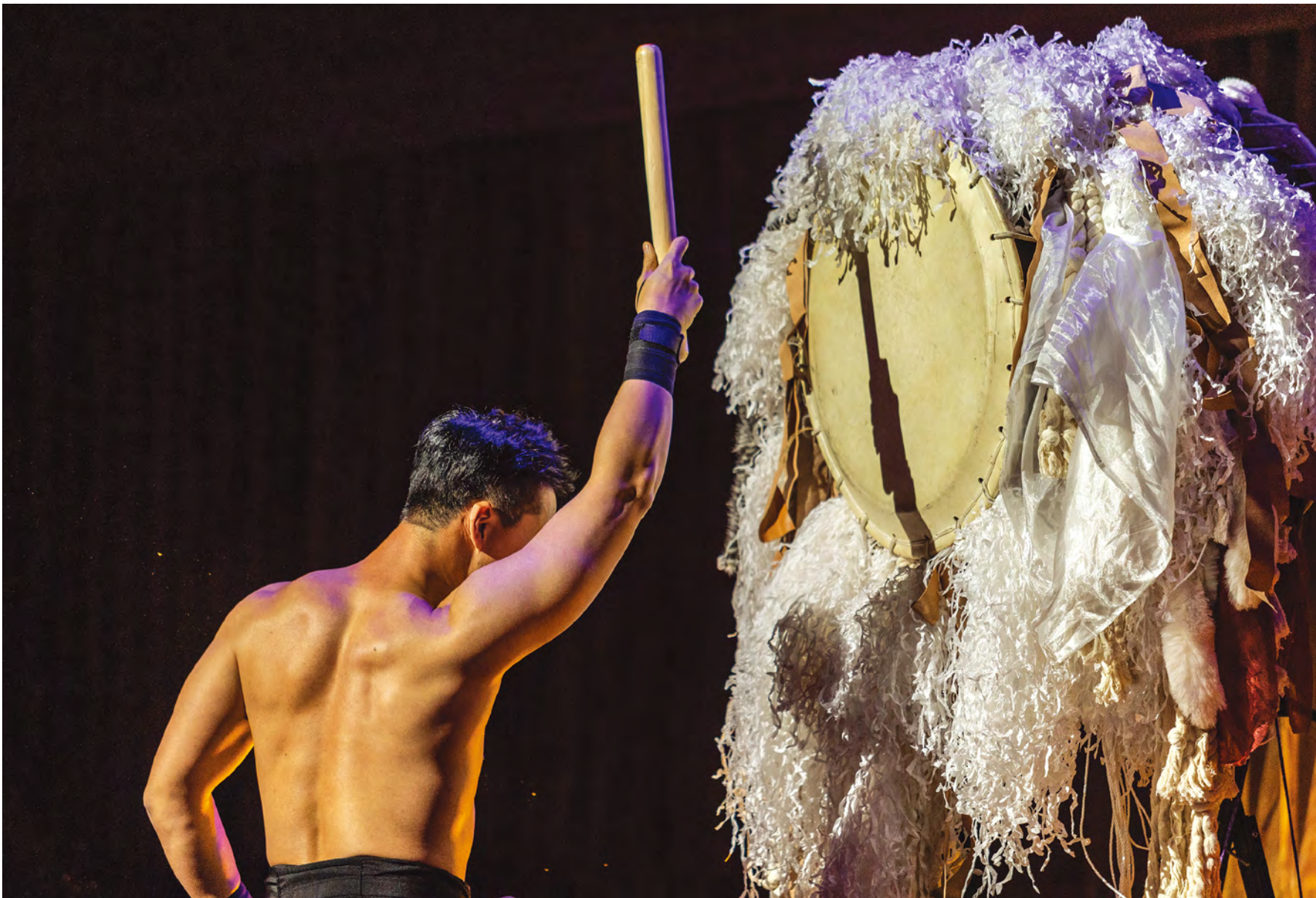
↗ Concert for the 60th anniversary of diplomatic relations between Korea and Argentina, TAGO, 2022, Centro Cultural Kirchner