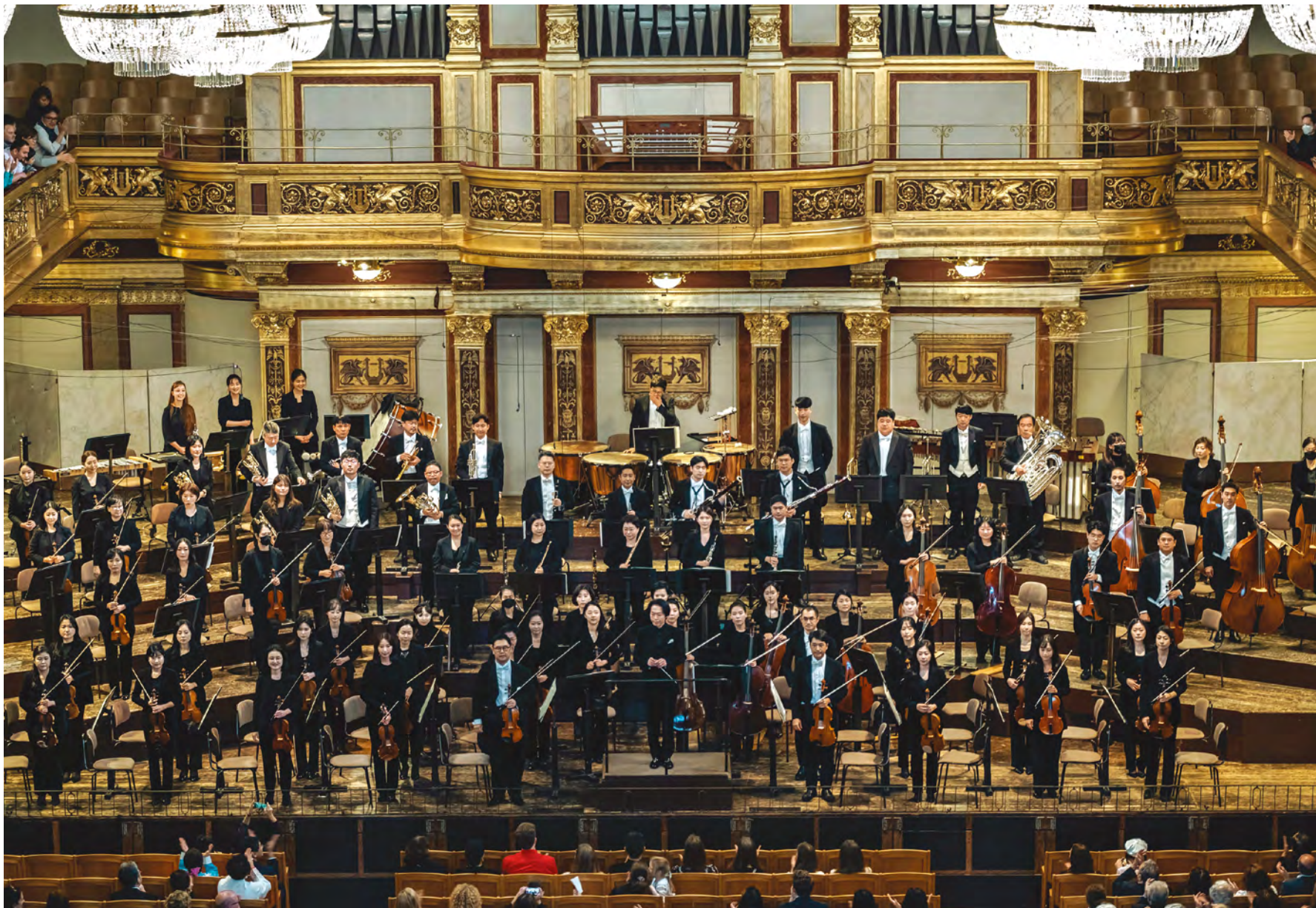
➤ Europe Tour 2022, Korean National Symphony Orchestra, 2022, Wiener Musikverein Golden Hall