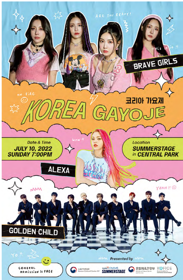
가 뉴욕 코리아가요제, 2022, SummerStage_1