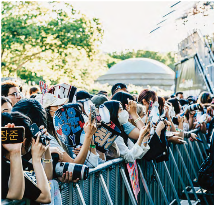
가뉴욕 코리아가요제, 2022, SummerStage_6 가 뉴욕 코리아가요제, 2022, SummerStage_4(브레이브걸스) 뉴욕 코리아가요제, 2022, SummerStage_5

international recognition, debuting in the top 10 on Billboard's World Digital Song Sales Chart. In 2020, she inked a deal with ICM Partners, a renowned agency representing global icons like Nicki Minaj and Khalid, signaling her foray into the global music arena.