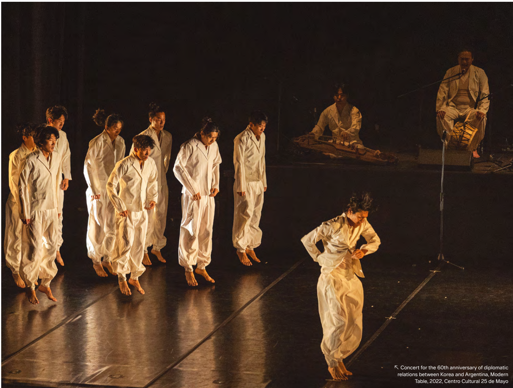
Concert for the 60th anniversary of diplomatic relations between Korea and Argentina, Modern Table, 2022, Centro Cultural 25 de Mayo